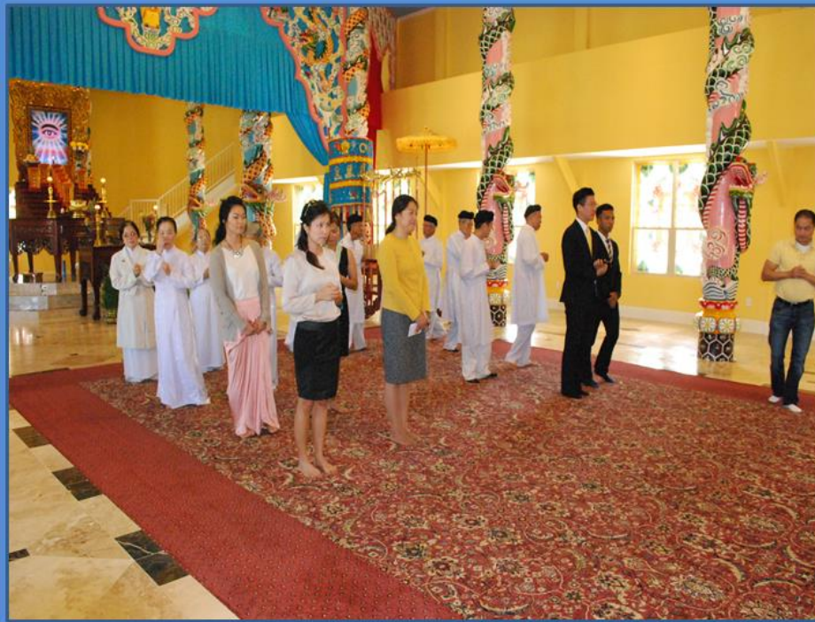
Phái đoàn HWPL và đồng đạo cầu nguyện