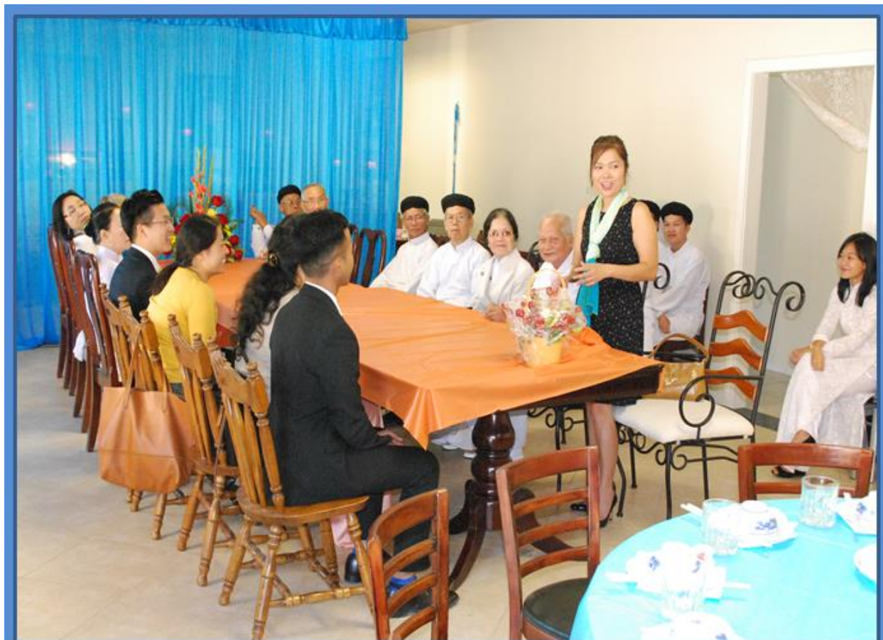
Đàm thoại giữa phái đoàn HWPL và đồng đạo