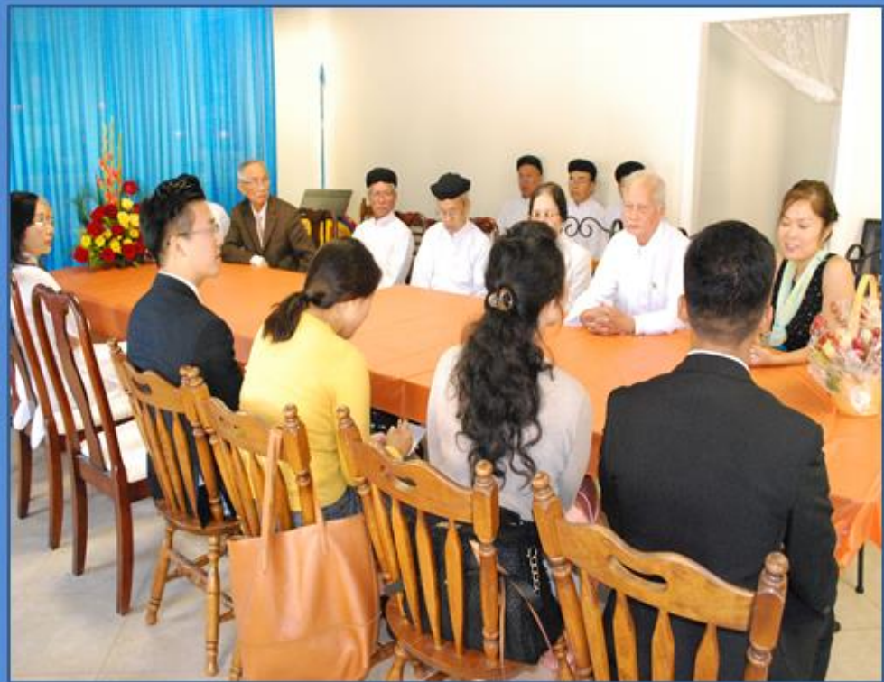
Cuộc đàm thoại thân mật giữa phái đoàn HWPL và đồng đạo TTCD Houston