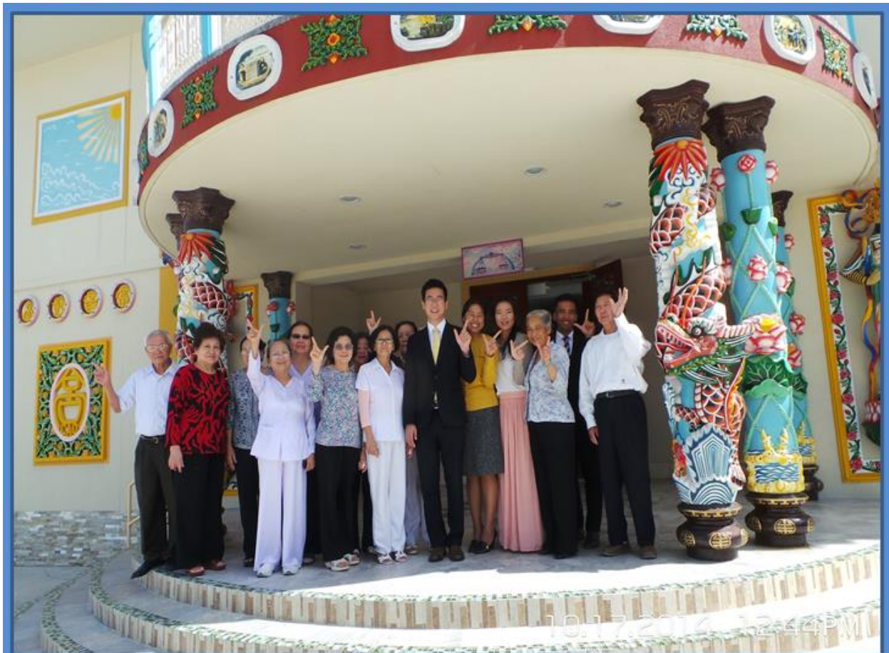
Các Cô, Chú, Bác trong đội âm thực và phái đoàn HWPL tại TTCĐ Houston TX

Cô giải thích trên trần nhà Thánh Thất Cao Đài hay Toà Thánh Tây Ninh có rất nhiều vì sao là biểu tượng hình thể của cần khôn vũ trụ, trong đó cột rồng là những biểu tượng của những chức năng vận hành trong Trời Đất, còn Thiên Nhân và các Thánh Thể trên Bát Quái Đài là hệ thống điều khiển sự vận hành của cần khôn vũ trụ. Đối với Cao Đài vô vi và hữu vi, con người thế gian và các thần linh, hay Thiên Thượng và Thiên Hạ, cùng hợp tác làm việc trong việc vận chuyển cần khôn bát quái.