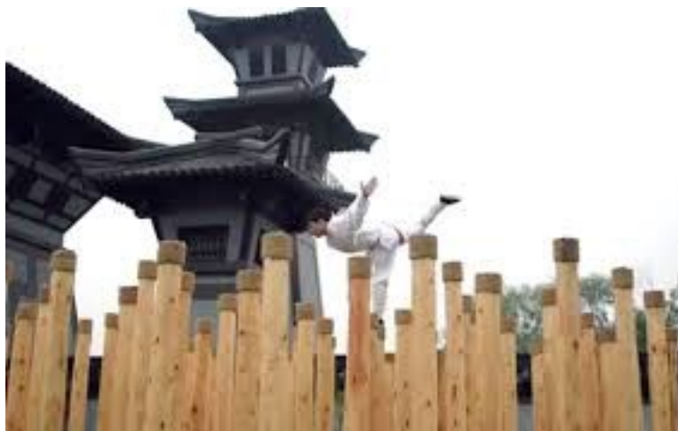
Một võ sinh múa quyền trên Mai Hoa Thung.