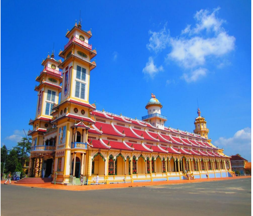
Tòa Thánh Tây Ninh