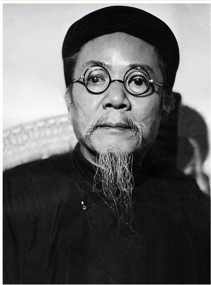
ĐỨC QUYỀN GIÁO TÔNG LÊ VĂN TRUNG