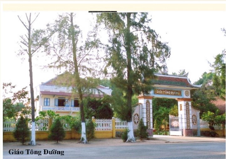
Giáo Tông Đường