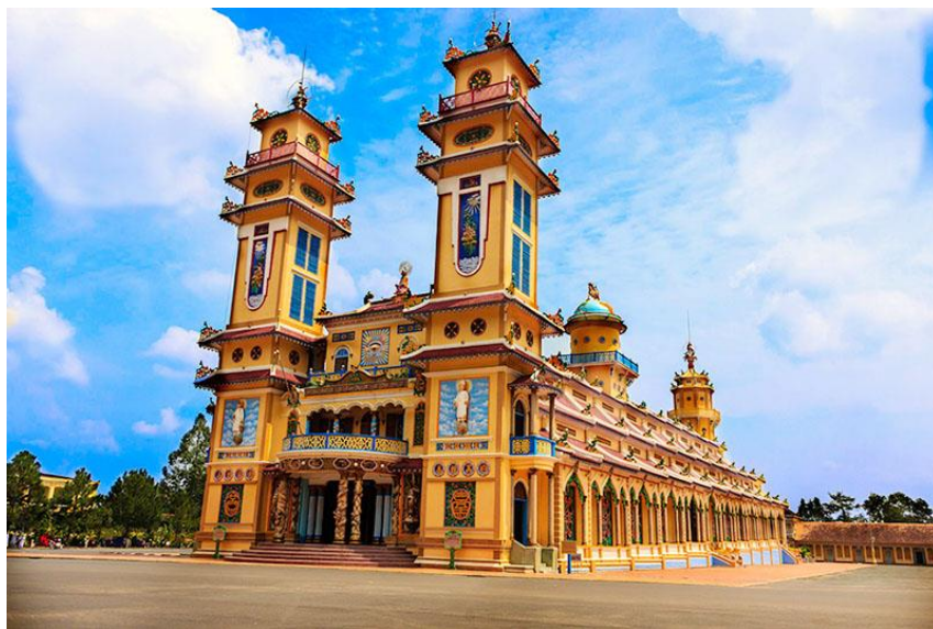
Xuân Tâm Linh (2020 - 2021)