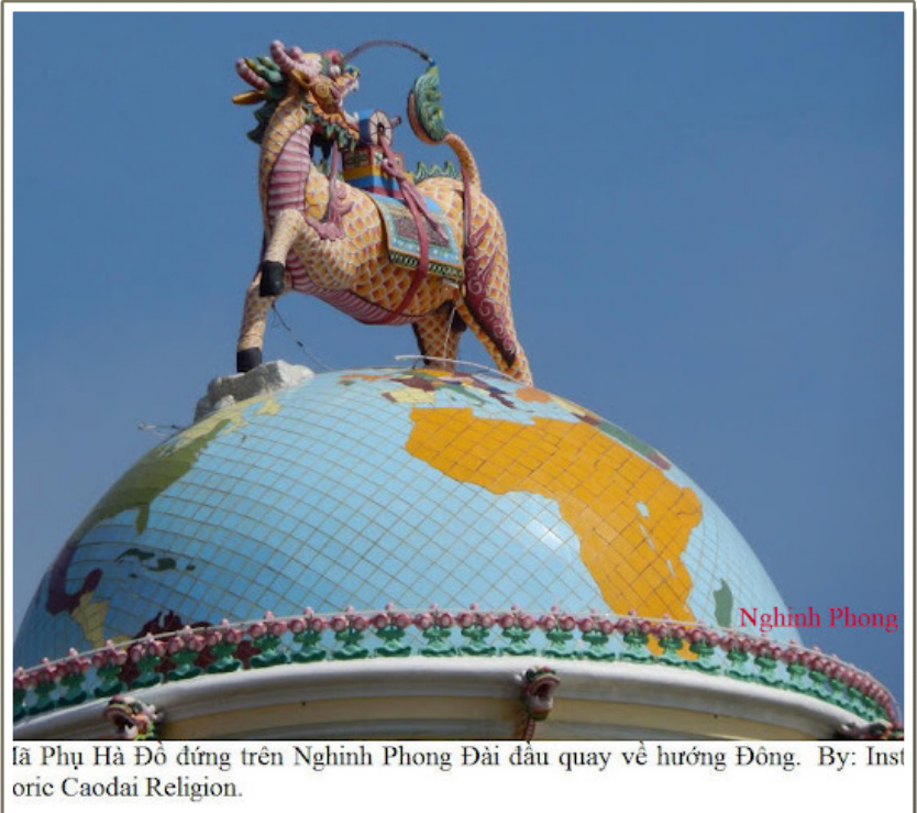
lã Phụ Hà Đồ đứng trên Nghinh Phong Đài đầu quay về hướng Đông. By: Instoric Caodai Religion.

một vị bần hèn khổ não để đi xin từ chén cơm, từ miếng bánh mì dạng nuôi kẻ đói khó. Đó là bài học trước mắt phàm chúng ta đã thấy.