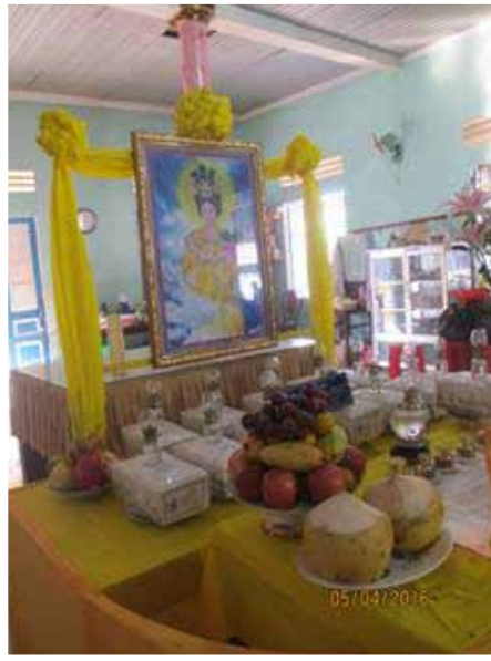
Hình Thất Nương và các hộp tro cốt