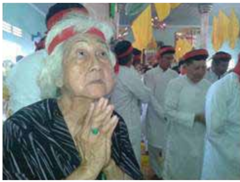
Hình cháu của Bà cùng chư tín đồ để tang