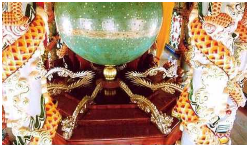
Rồng màu Trắng nơi Bát Quái Đài tượng trưng cho Bạch Dương Đại Hội trong Tam Kỳ Phổ Độ

Rồng Màu Trắng Tượng Trưng Cho Tam Kỳ Phổ Độ. Trong Đền Thánh có tất cả 28 cột rồng. Đức Chí Tôn cưỡi rồng tuần du. Rồng tượng trưng cho sự biến hóa. Đó là ý nghĩa tượng trưng và thay thế cho “Nhị Thập Bát Tú” tức các Đấng Thần, Thánh, Tiên, Phật châu Thượng Đế nơi Bạch Ngọc Kinh.