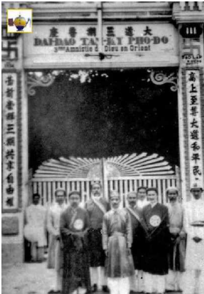
Hàng I. Đức Qu Giáo Tông, Đức Hộ Pháp, ĐS Ngọc Lịch Nguyệt. Hàng II. ĐS Thái Thơ Thanh. ĐS Ngọc Trang Thanh. ĐS Thượng Tương Thanh. ĐS Thái Bô Thanh. Chụp kỷ niệm trước cửa Hòa Viện năm 1929.