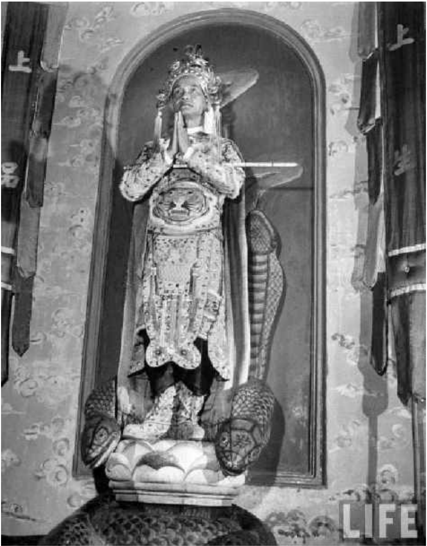
TAY NINH July 1948 - Caodaist Pope Pham Cong Tac wearing ornamented dress and crown, surrounded by serpents representing sin, beginning mass with sword portraying Caodaist tenet.