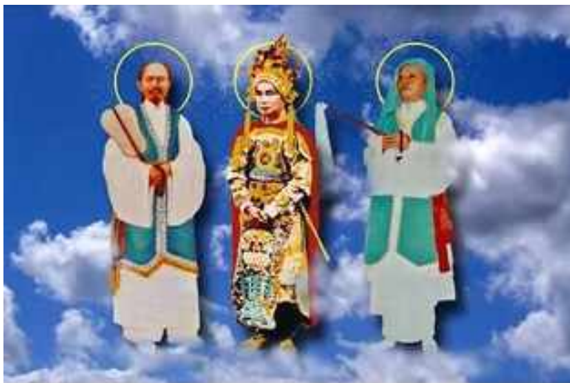
Từ Trái sang Phải: - Đức Thượng Phẩm Cao Quỳnh Cư, - Đức Hộ Pháp Phạm Công Tắc, và Đức Thượng Sanh Cao Hoài Sang. Đức Chí Tôn ủy nhiệm thành lập Đạo Cao Đài.

“Ngọc Hoàng Thượng Đế viết Cao Đài Tiên Ông Đại Bồ Tát Ma Ha Tát Giáo Đạo Nam Phương”.