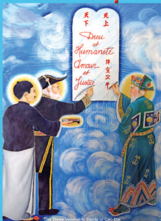
The Three Venerable Saints of Cao Đài