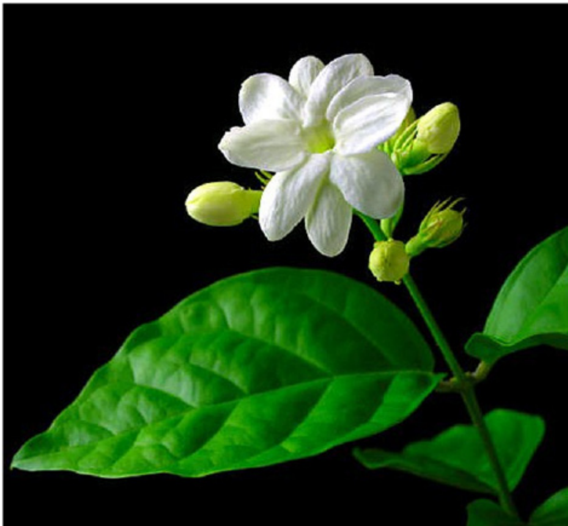
Philippines với hoa nhài Ảp