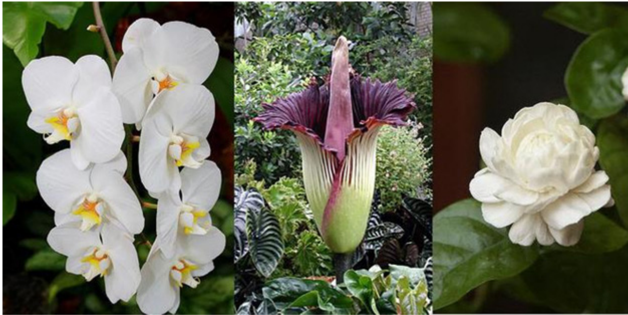
Indonesia với hoa nhài, lan mặt trắng và hoa xác thối