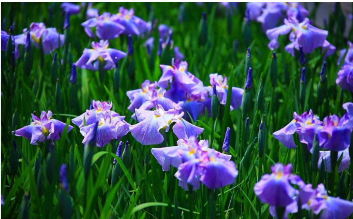
Iris, loài hoa biểu trưng cho nước Pháp