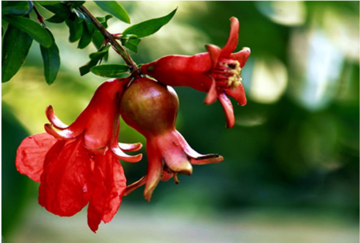
Thạch lựu thắp sáng Tây Ban Nha