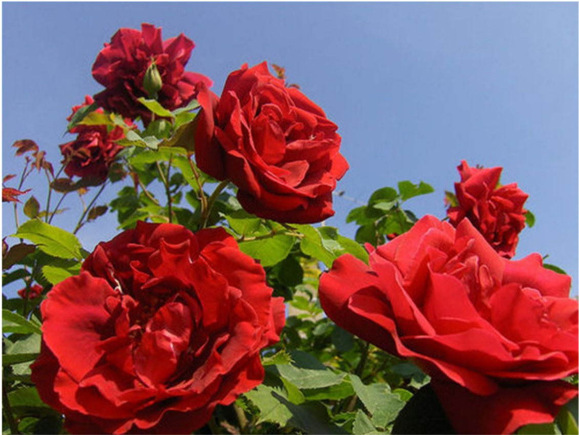
Hoa hồng đã chính thức được công nhận là quốc hoa của Mỹ vào ngày 20/11/1986.