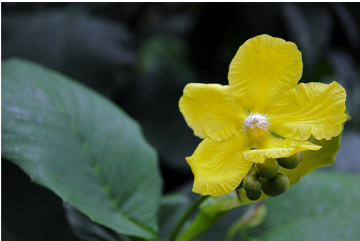
Brunei với hoa simpor