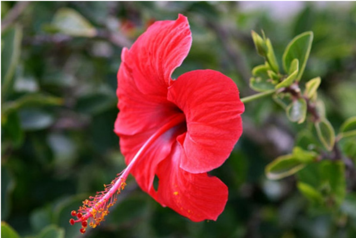
Hoa râm bụt bao hàm triết lý quốc gia dân tộc Malaysia