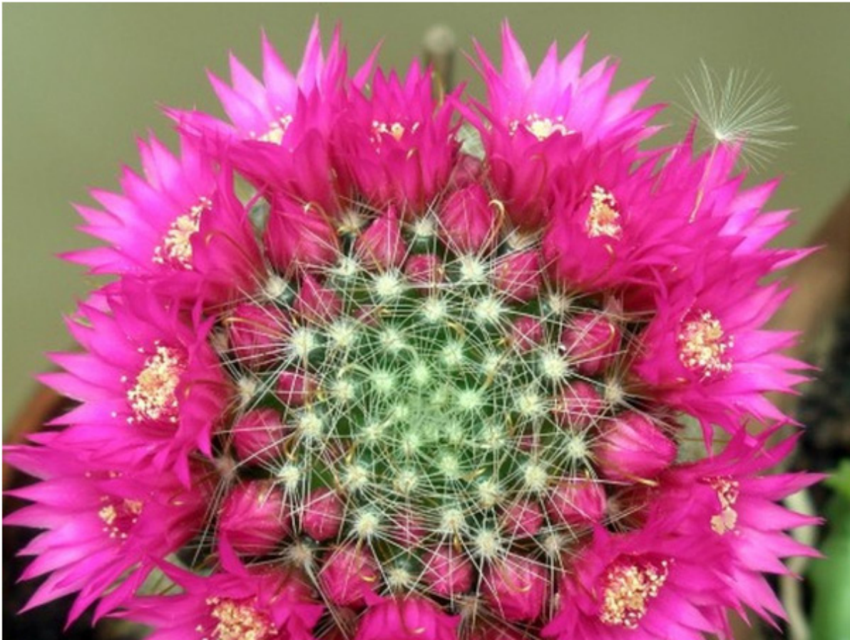
Xương rồng, quốc hoa Mexico