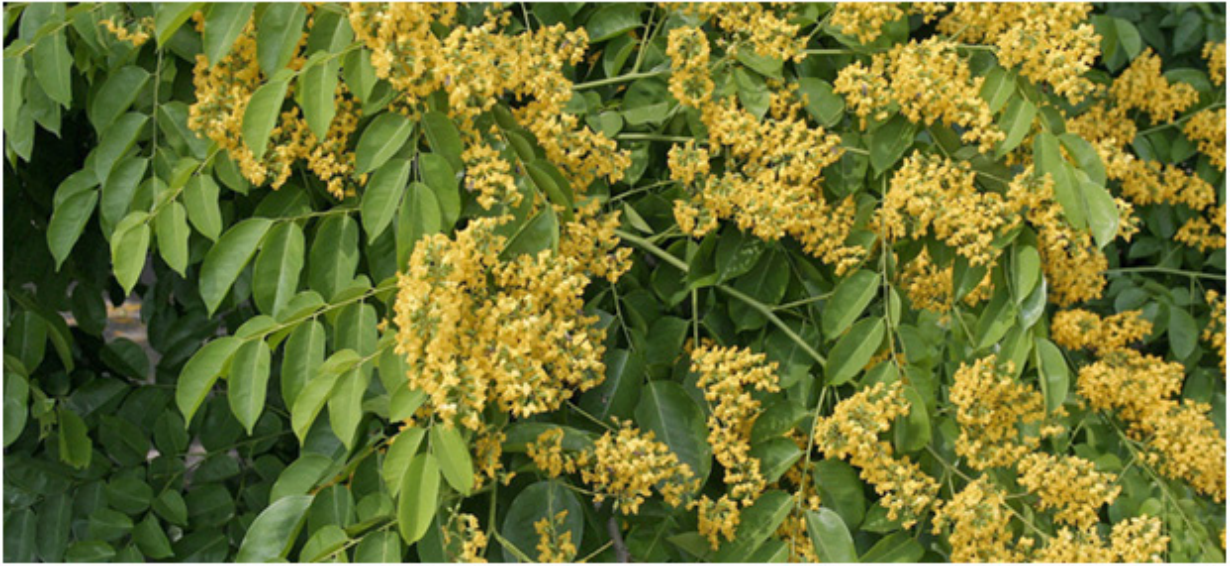
Myanmar, hoa dáng hương mắt chim