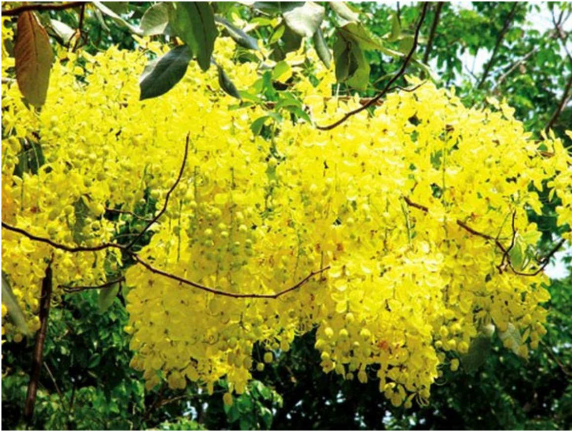
Hoa muồng hoàng yến, sắc vàng tâm linh của xứ sở chùa vàng Thái Lan