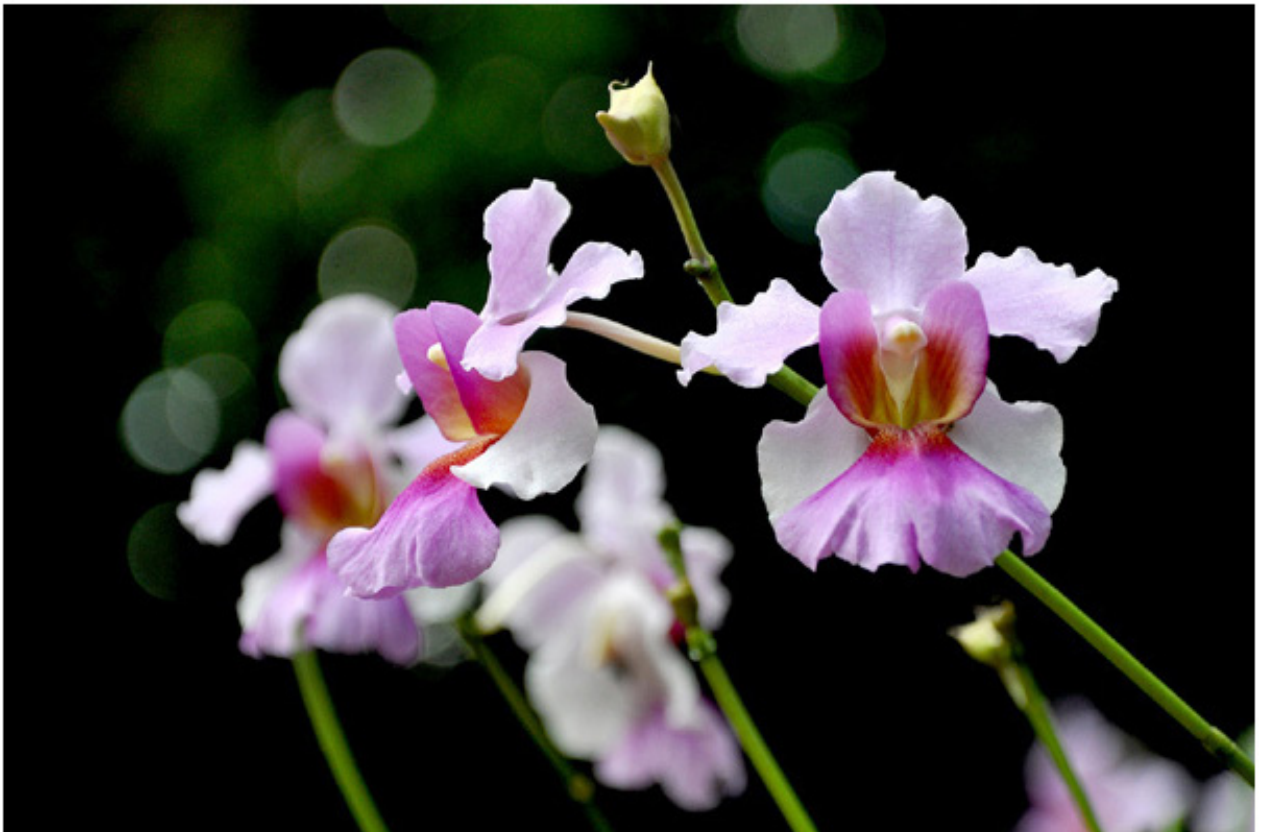
Singapore với hoa lan "miss joaquim"