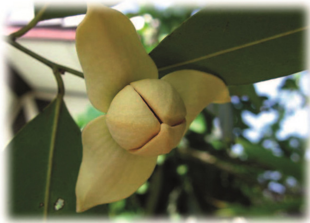
Campuchia với hoa rumdul