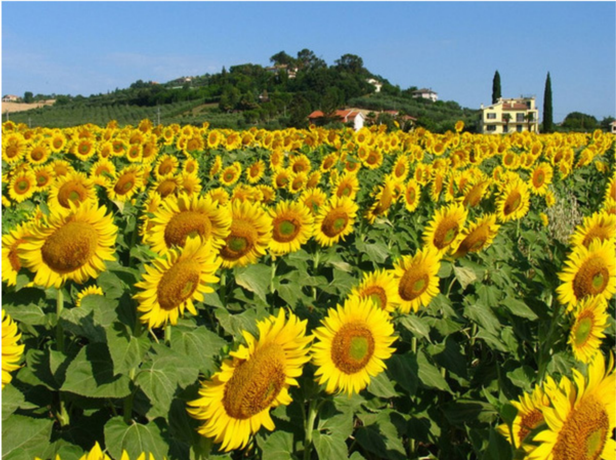
Hoa hướng dương, hiện thân của Người Nga với tâm hồn Nga, tính cách Nga