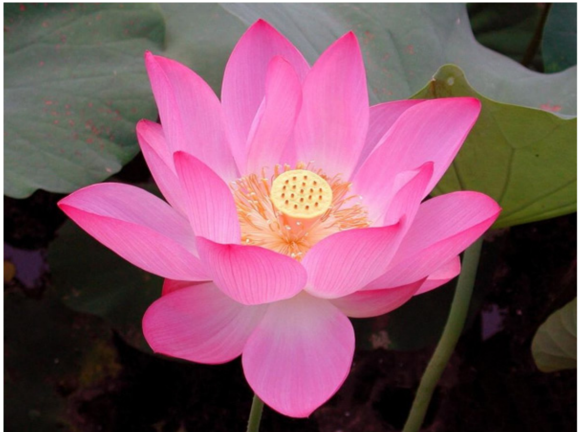
Hoa sen cũng được chọn là quốc hoa Ấn Độ