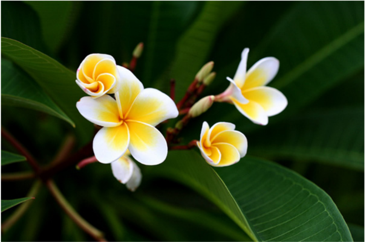
Lào với hoa đại (champa)