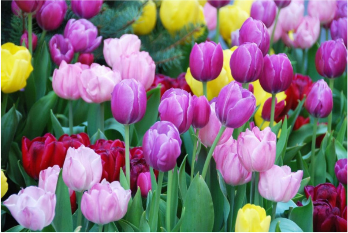
Hà Lan, xứ sở của hoa Tulip