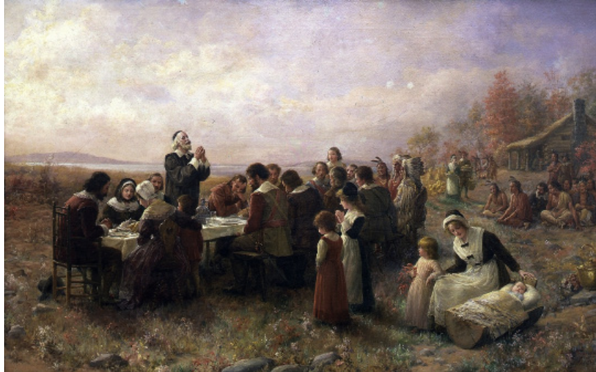
Bức tranh The First Thanksgiving at Plymouth (Lễ Tạ ơn đầu tiên tại Plymouth) của Jennie A. Brownscombe năm 1994

Lễ Tạ ơn ( tiếng Anh : Thanksgiving) là một ngày lễ hàng năm được tổ chức chủ yếu tại Hoa Kỳ , Canada , một số đảo ở Caribe và Liberia . Ý nghĩa ban đầu là mừng thu hoạch được mùa và tạ ơn Thiên Chúa đã giúp cho cuộc sống no đủ và an lành. Đây cũng là ngày nghỉ lễ chính thức cho tất cả người lao động tại Mỹ và Canada.