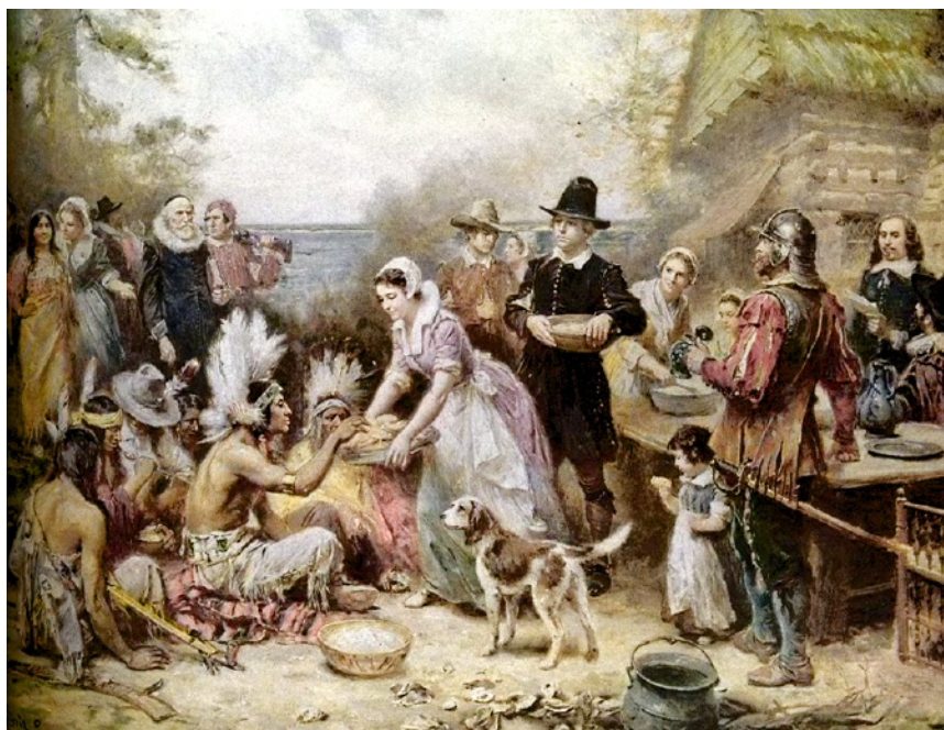
Bức tranh The First Thanksgiving của Jean Leon Gerome Ferris , người da trắng mời người da đỏ cùng ăn