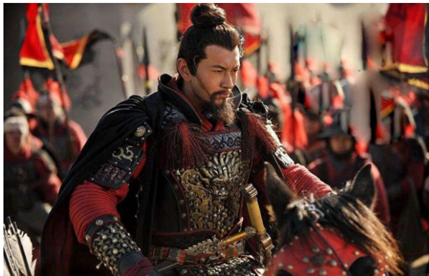
Tạo hình Nhạc Phi trên phim.

Trong lịch sử, những điển tích quên mình vì nghĩa nhiều vô số. Như Tô Vũ 19 năm khổ ải chặn dê, Trương Tuần tận vong báo quốc, sự trung thành của Phụ tử Nhạc Phi... tất cả đã viết nên một thiên sử: “ Nhân sinh tự cổ thù vô tử? Lưu thủ đan tâm chiếu hãn thanh ” (Sống ở trên đời từ cổ chí kim, hỏi có ai không chết? Nguyên giữ lòng son này chiếu rọi sử xanh). Tả Quang Đầu, Đàm Tự Đồng... những danh nhân này chỉ cần buông bỏ đức tin đạo nghĩa trong lòng mình thì đều được hưởng vinh hoa phú quý, nhưng họ đều không tham sống sợ chết.