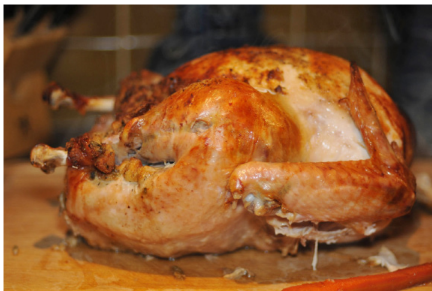
Gà tây nướng lò, một món ăn thường thấy trong ngày Lễ Tạ ơn

Lễ Tạ ơn thường được tổ chức với một buổi tiệc buổi tối cùng với gia đình và bạn bè với món thịt gà tây . Tại Canada và Hoa Kỳ, nó là một ngày quan trọng để gia đình sum họp với nhau, và người ta thường đi xa để về với gia đình. Người ta thường được nghỉ bốn ngày cuối tuần cho ngày lễ này