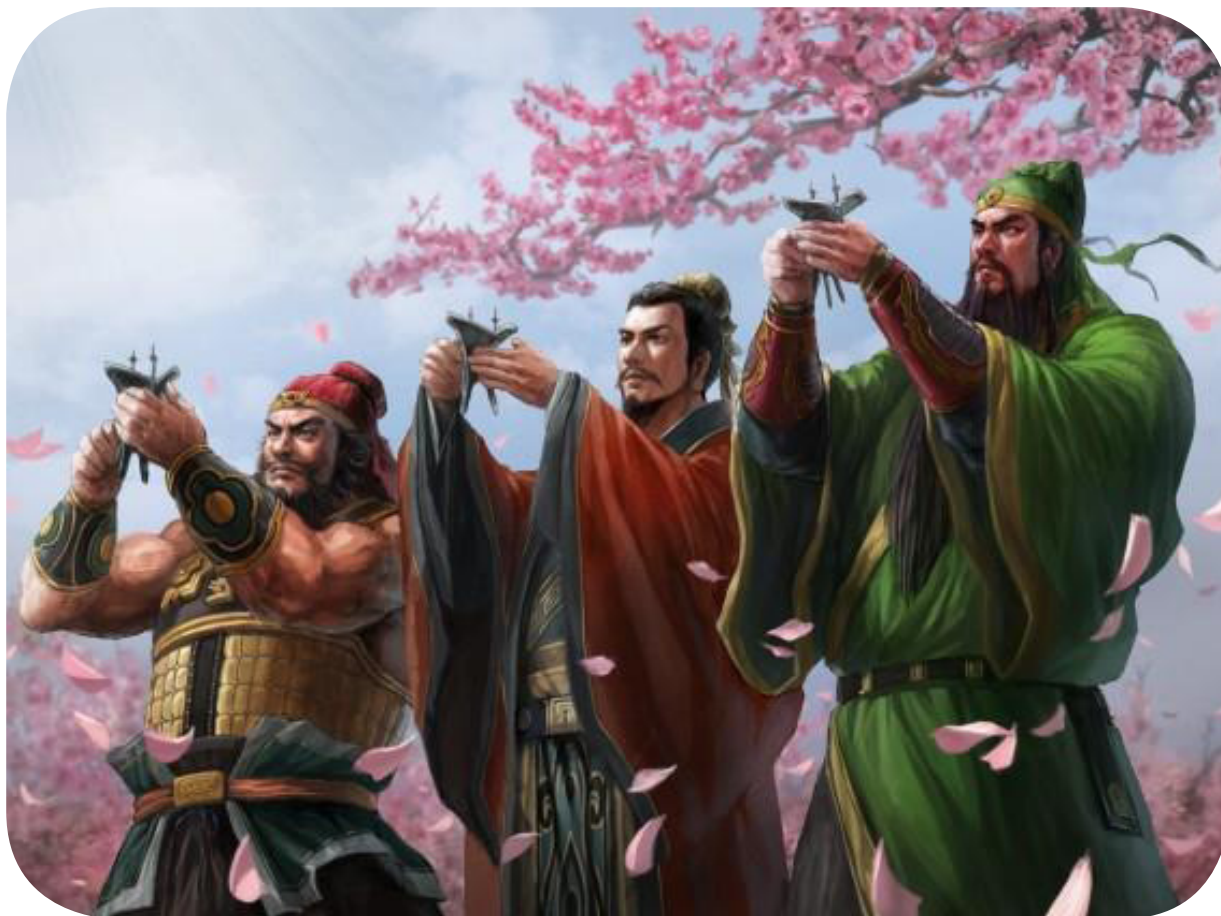
Quan Vũ, Lưu Bị và Trương Phi. Kết nghĩa vườn đào, thề cùng sinh tử.

Đó là tình bạn giống như mối quan hệ giữa Quan Vũ và Lưu Bị. Kết nghĩa vườn đào, thề cùng sinh tử, Quan Vũ là em, là trợ thủ đồng thời cũng là tri kỷ của Lưu Bị. Ở dưới trướng Tào Tháo, dù hưởng vinh hoa phú quý, bạc vàng mỹ nữ, được ân phong hầu nhưng Quan Vũ trước sau vẫn một lòng hướng về Lưu Bị khi ấy cũng đang phiêu dạt bốn bề, tay trắng dựng nghiệp. Sau, nghe tin Lưu Bị đang ở chỗ Viên Thiệu, Quan Vũ cưỡi Xích Thố không quản ngày đêm vượt nghìn dặm tìm về.