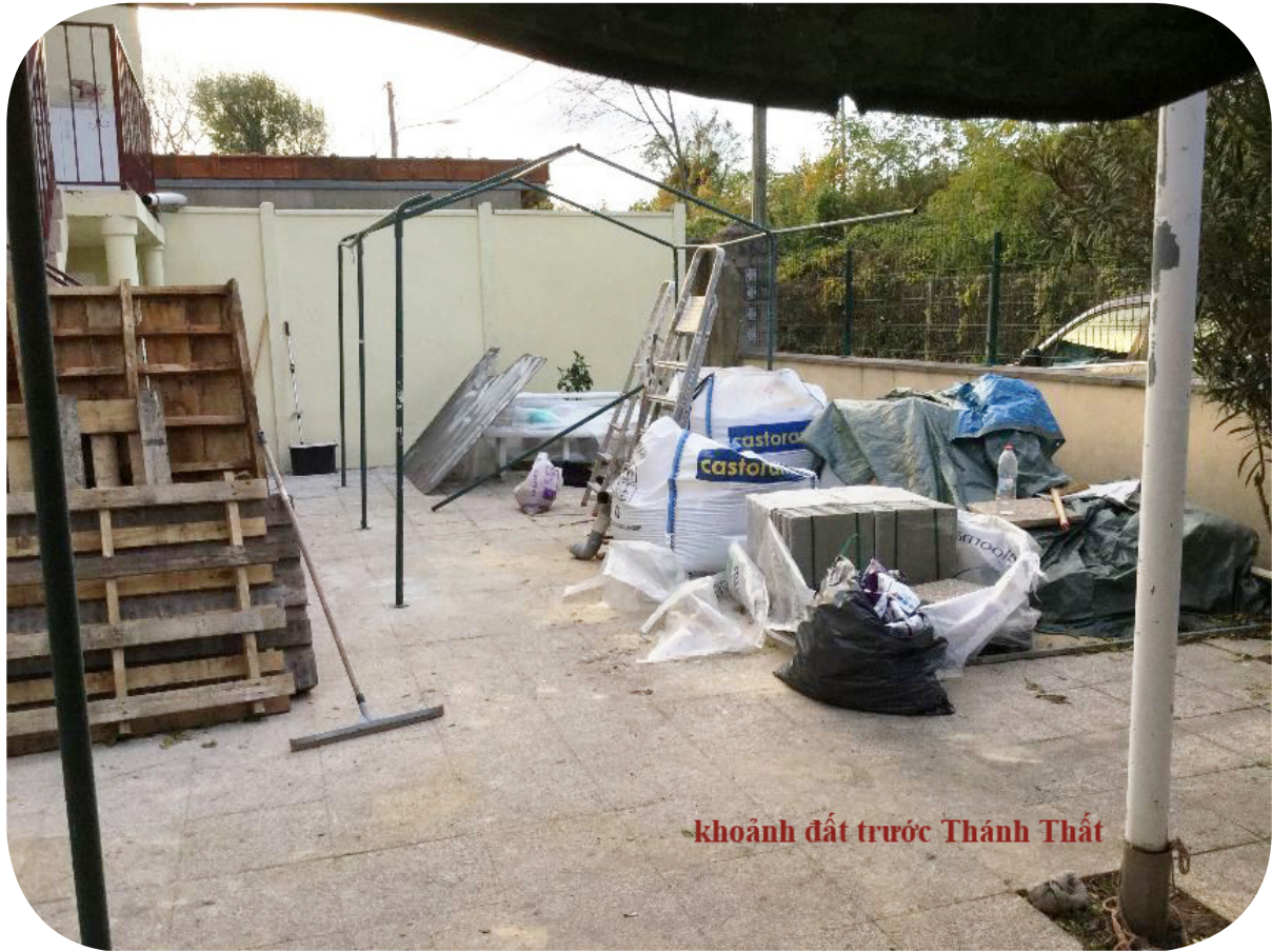
khánh đất trước Thành Thất