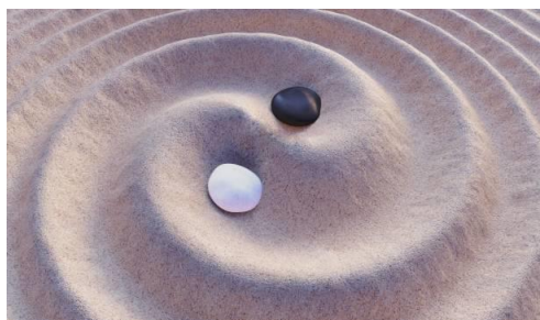
Đá đen trắng trên cát. Biểu tượng Âm Dương