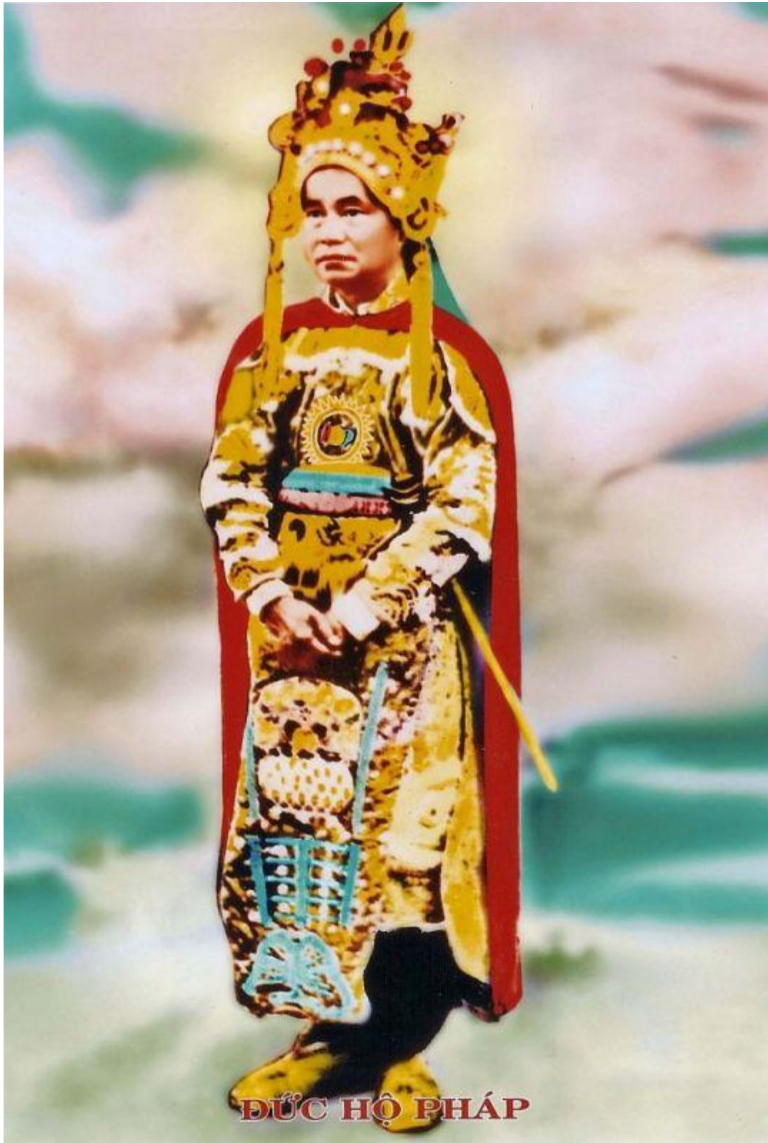
Chân dung ĐỨC HỘ PHÁP Phạm Công Tắc The portrait of ĐỨC HỘ PHÁP Phạm Công Tắc